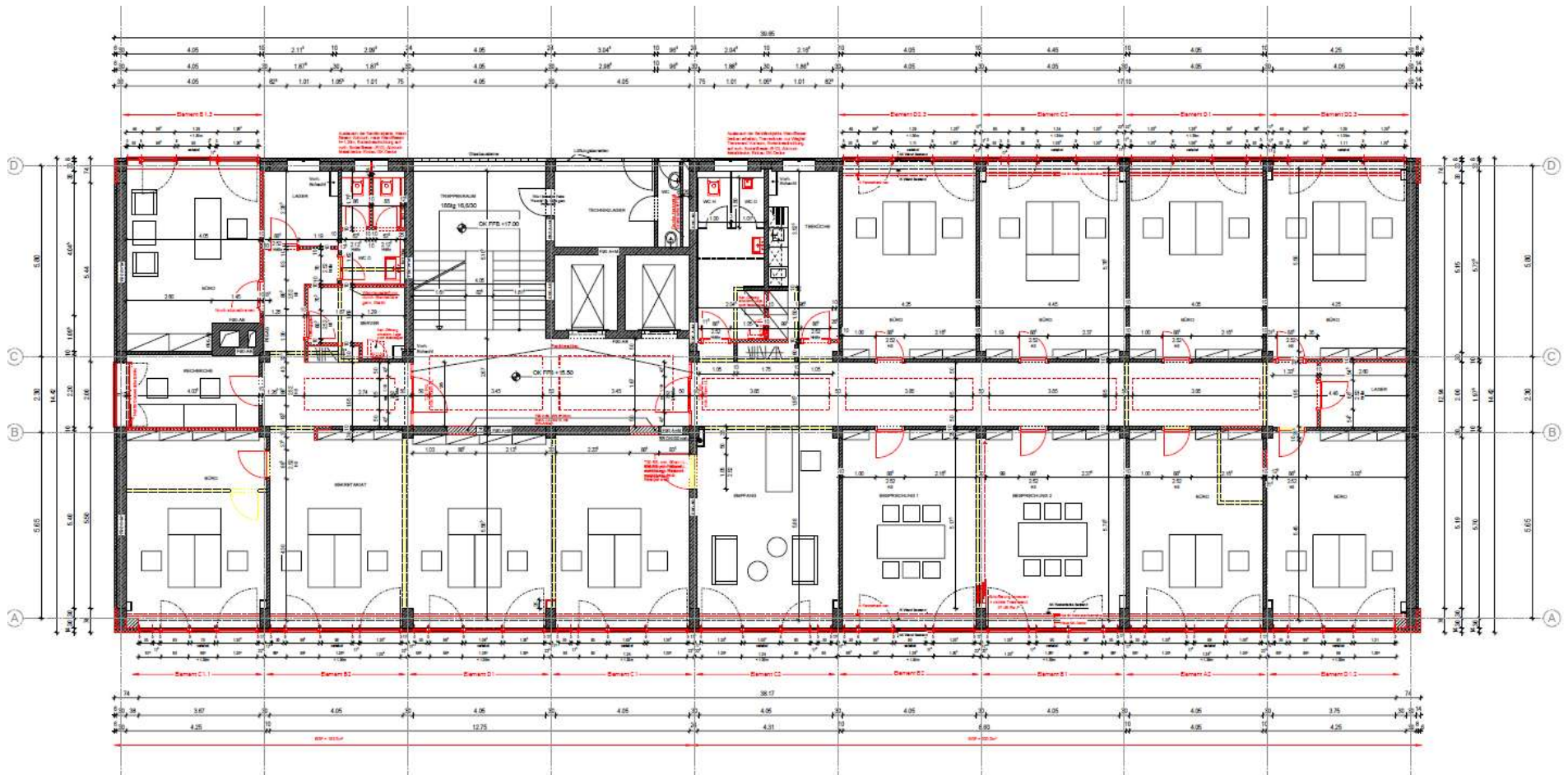
Grundriss 5.Obergeschoss 472,1 m 2